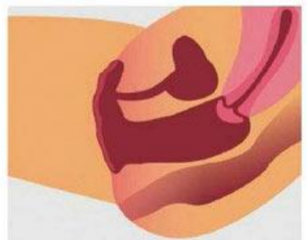
Canal vaginal dilaté