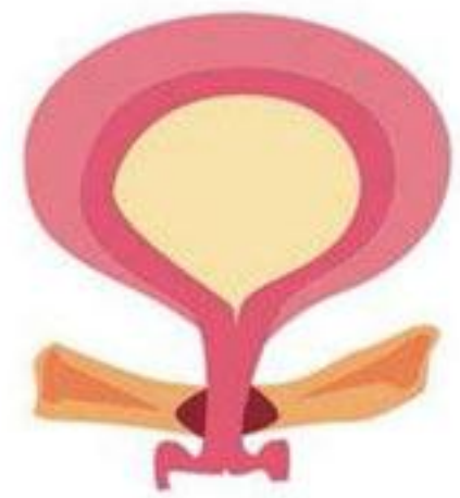
Muscle pelvien puissant

Les femmes souffrant d'incontinence urinaire d'effort ont un métabolisme altéré du tissu conjonctif, ce qui entraîne une diminution de la production de collagène et cause un soutien insuffisant du tractus urogénital.