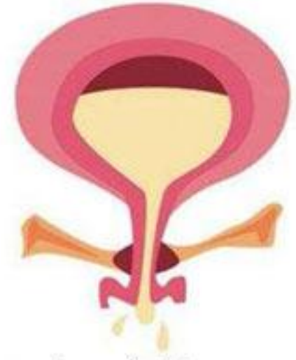
Muscle pelvien faible

Le traitement laser restaure le métabolisme du tissu conjonctif et une amélioration de l'état de la muqueuse. Des améliorations sont signalées au bout d'un mois, les symptômes de l'incontinence urinaire d'effort sont significativement réduits.